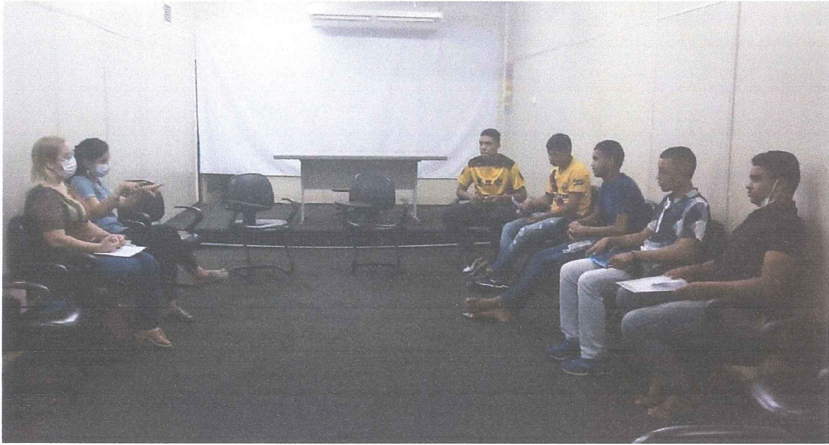
Oficina de apresentação e acolhimento de jovens das Casens no Projeto