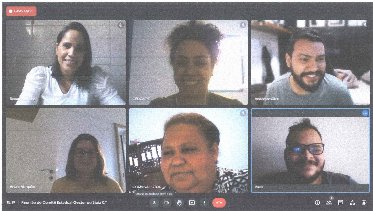
Reunião Ordinária do Comitê Estadual do SIPIA Conselho Tutelar