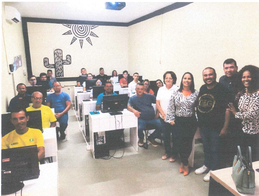
Formação de Uso do SIPIA Conselho Tutelar para Municípios de Santa Cruz do Capibaribe, Bezerros e Taquaritinga do Norte