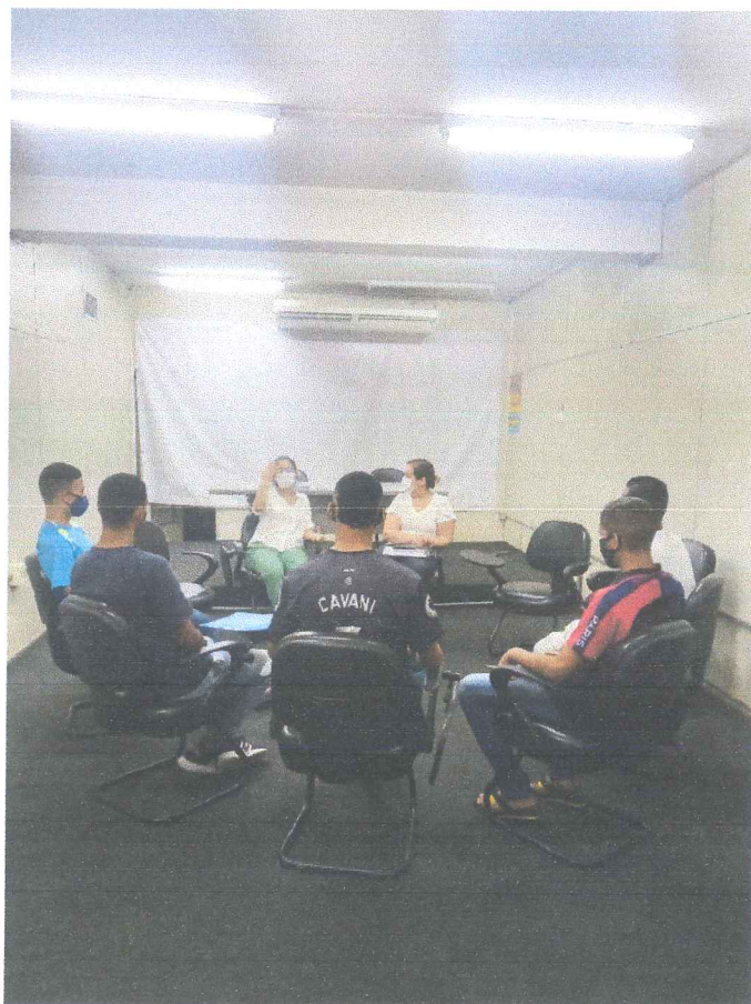
Reunião Ordinária do CIPPSR PE