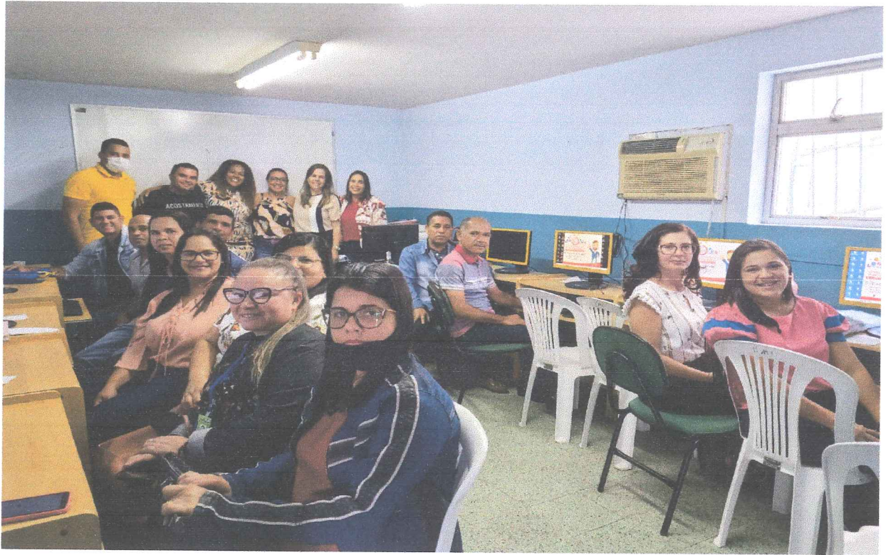
Formação de Uso do SIPIA Conselho Tutelar para Municípios de Surubim, Bom Jardim, Santa Maria do Cambucá e Vertente