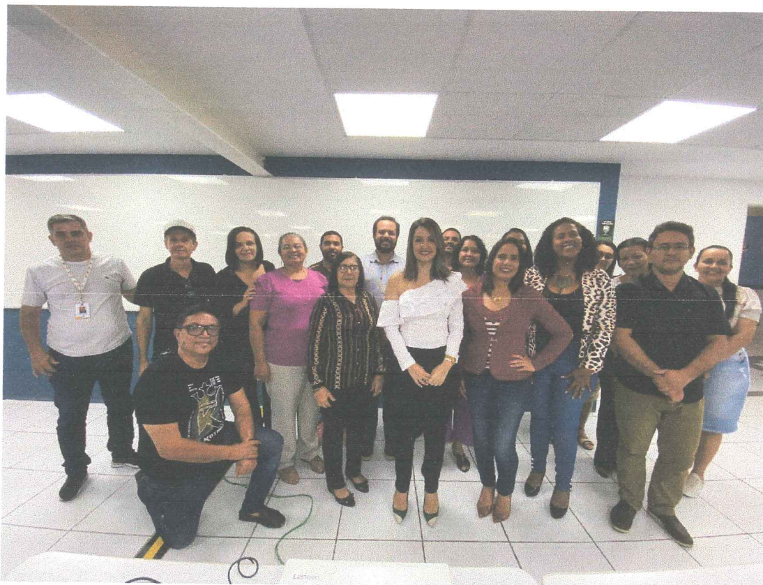
Formação de Uso do SIPIA Conselho Tutelar para Municípios do Consórcio Dom Mariano (Pesqueira, Tupanatinga, São Caetano e Tamandaré) realizada em Caruaru/PE.