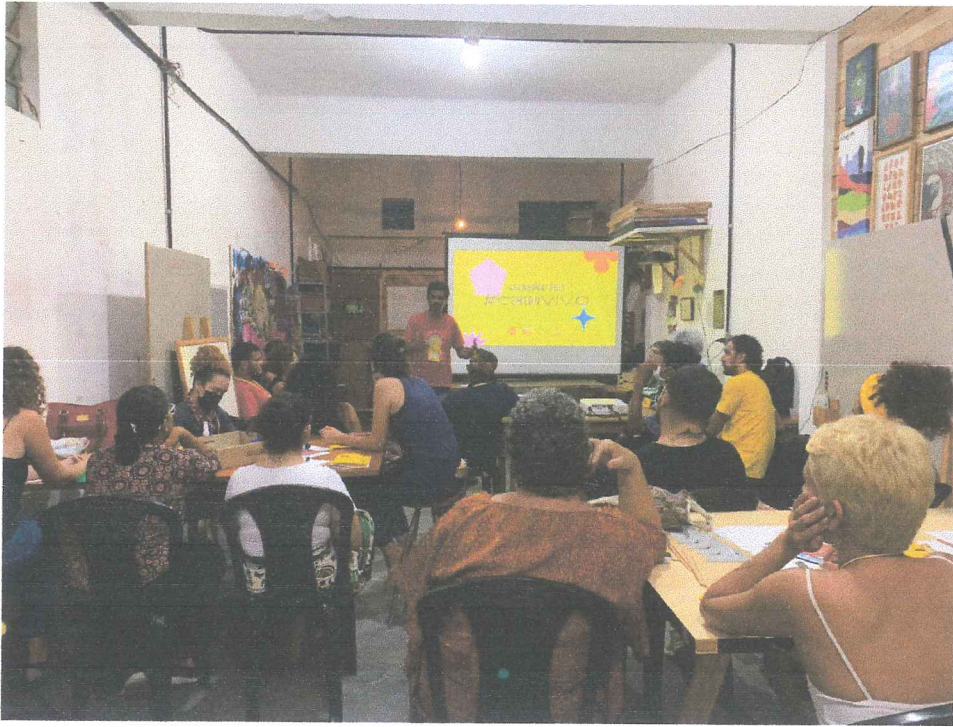
Promoção de oficina de apresentação e acolhimento no Projeto.