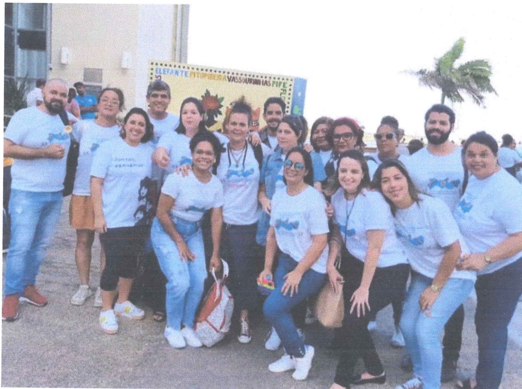
Participação no Ato Público na Ação de Enfrentamento de Abuso e Exploração Sexual contra Crianças e Adolescentes.