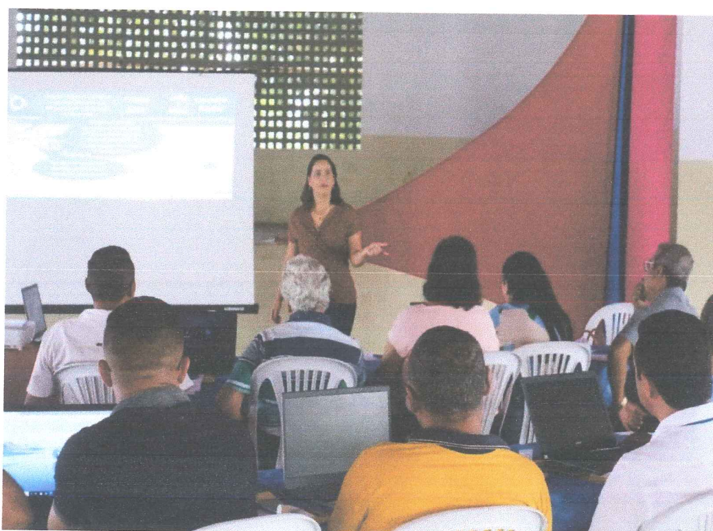
Promoção de palestra sobre a importância de uso do SIPIA Conselho Tutelar para Município do Paulista