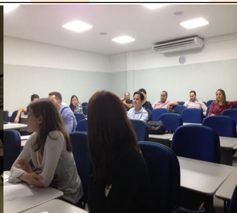
Palestra na Mauricio de Nassal