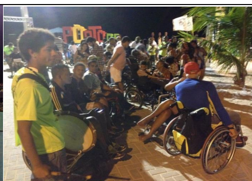
Fotos do evento do Praia sem Barreiras em Porto de Galinhas