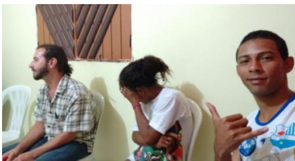
GRUPO BOA NOITE