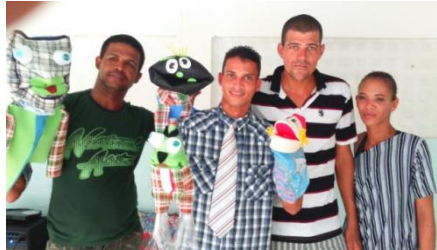
APRESENTAÇÃO DE MARIONETES