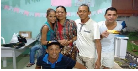
SÃO JOÃO NO PLANTÃO NOTURNO