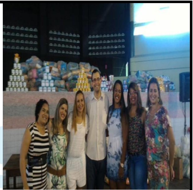
Mães de bebês com microcefalia recebendo os donativos no evento.