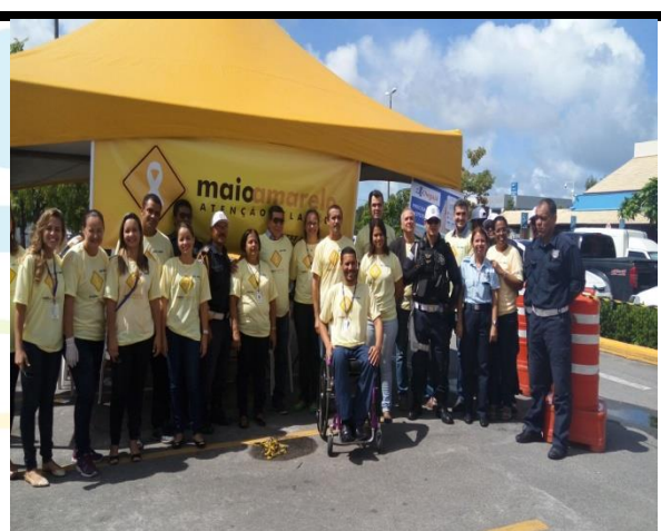
A equipe do MAIO AMARELO, com a participação da SEAD.