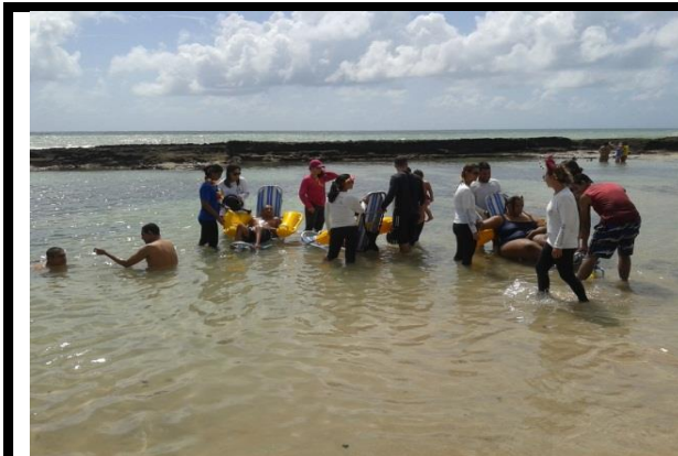
Pessoas com deficiência sendo atendidas pelos profissionais do Praia sem Barreiras.

SUPERINTENDÊNCIA ESTADUAL DE APOIO A PESSOA COM DEFICIÊNCIA – SEAD Av. Norte, Santo Amaro – Recife – PE - CEP: 50100-000 Fone: (81) 3183 3209 / 3183 3224