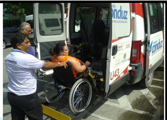
Usuária do PE Conduz chegando ao Praia Sem Barreiras.

O segundo passeio foi uma Rota de Lazer para o Arte no Paque, realizada no dia 23 de janeiro, no Sítio da Trindade, em Recife. Este passeio foi para qualquer usuário de cadeiras de rodas que solicitasse transporte através da inscrição realizada no site do evento.