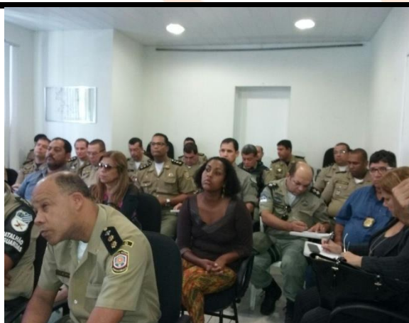
Público da sensibilização formado por oficiais da Polícia Militar.

A ação contou com a participação da Coordenadoria Estadual LGBT, Coordenadoria Estadual de Igualdade Racial e Superintendência Estadual da Pessoa Idosa. Todas também falaram sobre as abordagens durante o período festivo.