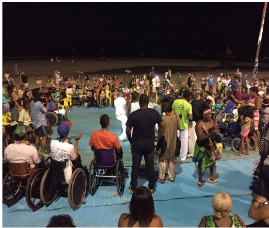
Público geral do Luau em Porto de Galinhas.

SUPERINTENDÊNCIA ESTADUAL DE APOIO A PESSOA COM DEFICIÊNCIA – SEAD Av. Norte, Santo Amaro – Recife – PE - CEP: 50100-000 Fone: (81) 3183 3209 / 3183 3224