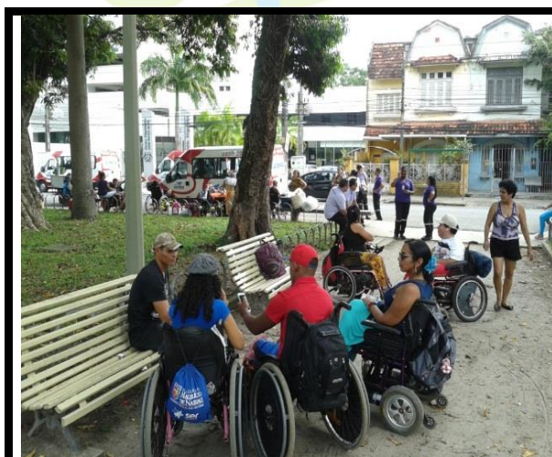
Concentração na Praça do Derby.

Foram inscritos 41 cadeirantes, mas apenas 13 usaram as vans do PE Conduz para deslocamento até Porto de Galinhas. As pessoas dormiram numa escola de Porto de Galinhas, espaço cedido pela prefeitura, e voltaram para Recife no domingo pela manhã.