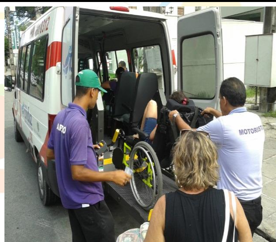
Deslocamento de usuário na van do PE Conduz.