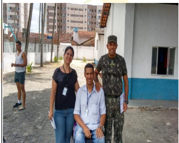
Equipe da SEAD com o Comandante do Quartel.