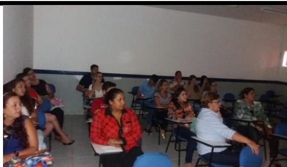
Público participante da capacitação.

Como encaminhamento, ficou a possibilidade de realizar outra visita, visto que houve poucos participantes. Acreditamos que a mudança do local da ação (que seria no novo endereço do Expresso Cidadão) para o Campus da UPE, dificultou o acesso dos funcionários. No entanto, quem pode participar ficou satisfeito com a abordagem e conteúdo apresentado (vide Fichas de Avaliação – Anexo C).