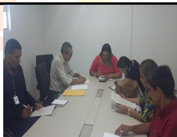
Equipe do município de Igarassu, com a SEAD e o CONED, trabalhando a minuta da Lei Municipal.