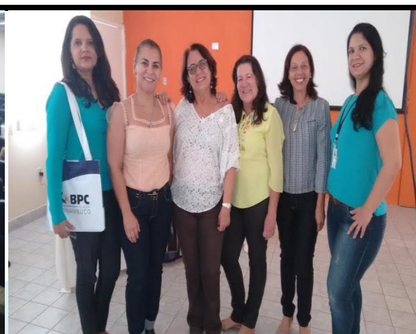
Grupo Gestor Estadual do Programa BPC na Escola, em Garanhuns.