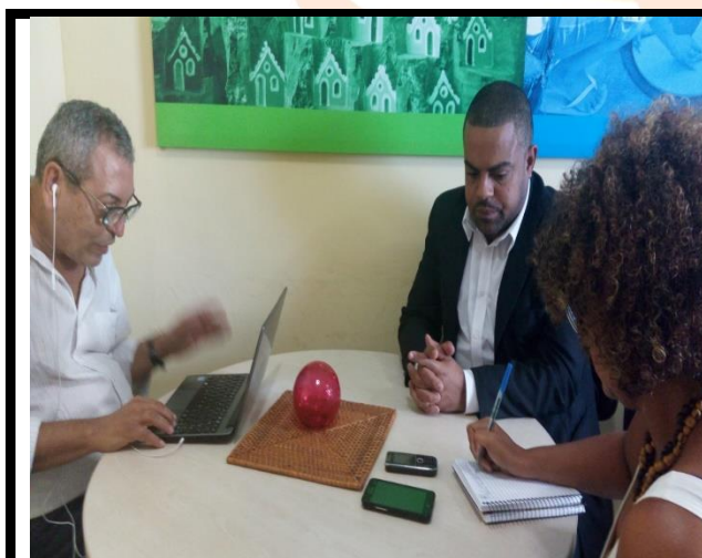
Reunião para implantação do Conselho Municipal da Pessoa com Deficiência de Olinda.