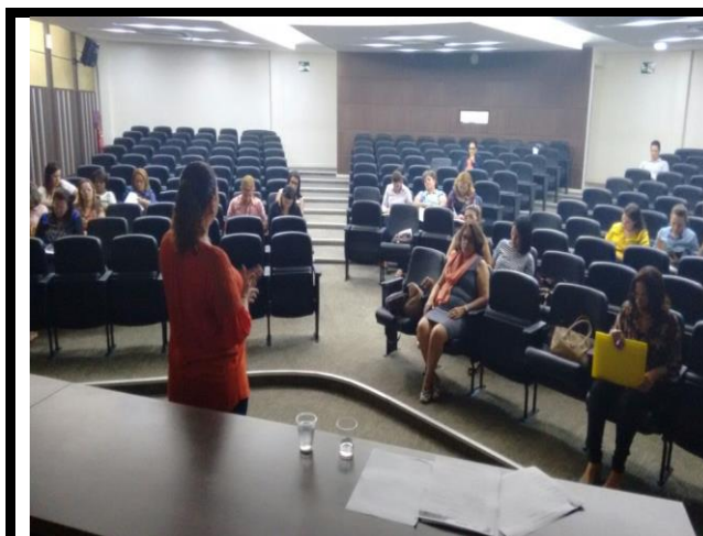
Auditório do evento em Caruaru.

SUPERINTENDÊNCIA ESTADUAL DE APOIO A PESSOA COM DEFICIÊNCIA – SEAD Av. Norte, Santo Amaro – Recife – PE - CEP: 50100-000 Fone: (81) 3183 3209 / 3183 3224