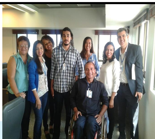
Equipe SEAD junto à equipe de serviço social do TRT.